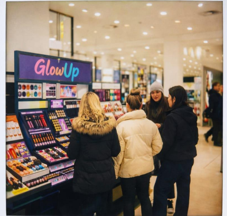
Workshop zum Chillen – aufgenommen von Jugendlichen (02/23)

BILDUNGSKONGRESS - MEHR ALS EIN ORT: AUßERSCHULISCHE BILDUNG STÄRKT AM 12.05.2026 IM SPORT STUTTGART.